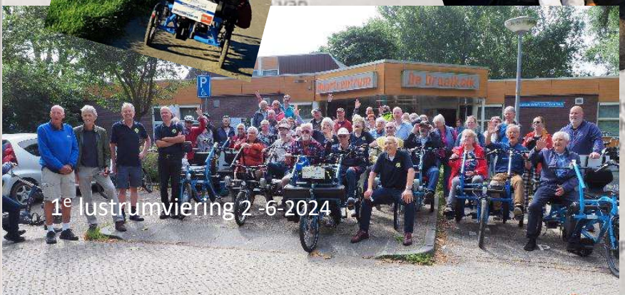
1 e lustrumviering 2-6-2024