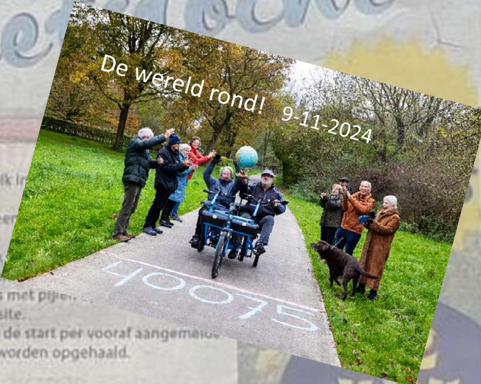
De wereld rond! 9-11-2024