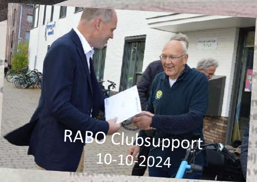
RABO Clubsupport 10-10-2024