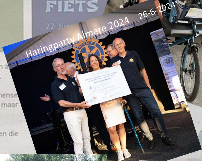
Haringparty Almere 2024